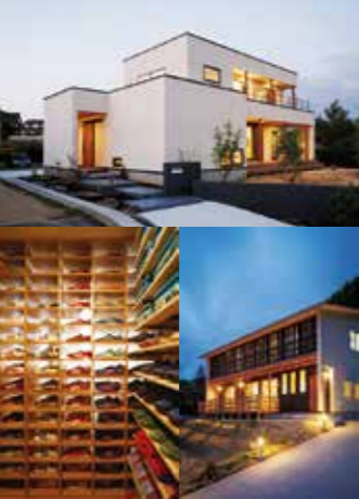
デザインをパターン化せず、一部一部、住まう人の理想に合わせて一から設計するため、同じ表情やスタイルの家はふたつとない。

ナチュラル、モダン、和風モダン、純和風…。住まう人の思いと目指す暮らしを形にしてくれる。そんな住まいを冬は暖かく夏は涼しい空間にしてくれるのが、人と家計、地球にも優しい「BEシステム」。