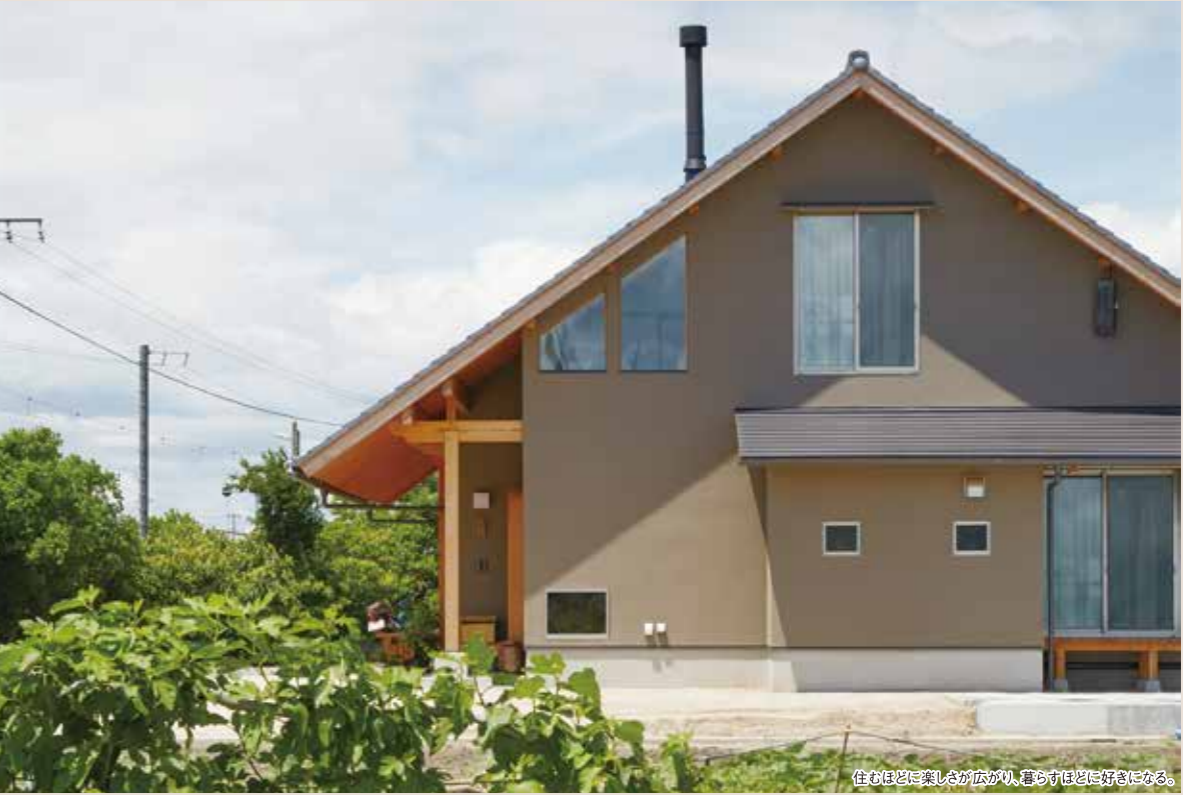
住むほどに楽しさが広がり、暮らすほどに好きになる。