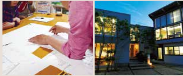
設計の「飛夢房」と施工の「北屋建設」。それぞれ専門のプロフェッショナルが一つの船の乗組員のように一体となり、オリジナリティに富んだ家づくりを進めていく。時に、家具やステンドグラス、陶芸などの作家とのコラボレーションも。

株式会社 一級建築士事務所 飛夢房 株式会社 北屋建設 〒440-0211 岡山市中区平井7-18-15-11 ☎ 0120-76-9523 🕒 9:00～18:00 📅 水曜、第1日曜、不定木曜 北屋建設