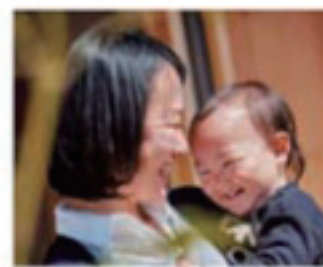
「気密性がいいから外の音が聞こえないし、風がよく通って涼しい」