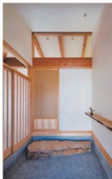
洗い出しの玄関は靴脱ぎ石とトチの木の木のカウンターがアクセント。どちらもご夫妻が購入