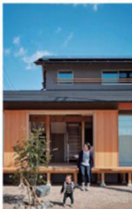
和モダンな落ち着いた外観。屋根には太陽光発電約4.6kW搭載し、「4月は1万8000円の収入」