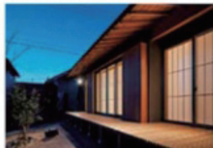
深い軒の下は広い縁側を設置。夜になると、明かりの漏れる障子のシルエットが趣を増す