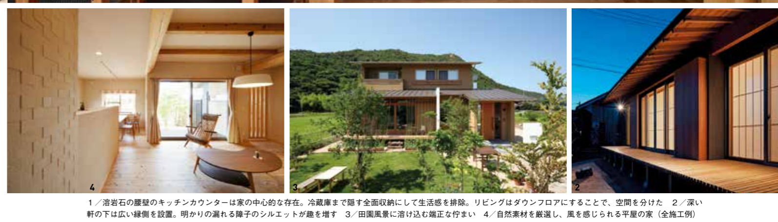
1/ 滑り石の壁のキッチンカウンターは家の中心的存在。冷蔵庫まで隠す全面収納にして生活感を排除。リビングはダウンフロアにすることで、空間を分けた。2/ 深い軒の下は広い緑を配置。明かりの漏れる障子のシルエツが趣を増す。3/ 田園風景に溶け込む端正な佇まい。4/ 自然素材を厳選し、風を感じられる平屋の家 (全施工例)