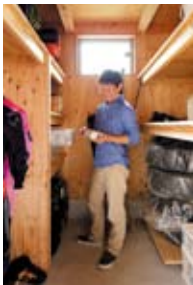
「夢の保管庫」には釣りやダイビング用品などがギッシリ。窓があり、光と風が通る設計