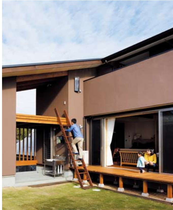
土間では屋外調理場を設け、魚をさばいたり、ダイビングウエアの手入れをしたり、野菜を洗ったり。土間の排水処理もバッチリなので気兼ねなく使える。上へ登るハシゴは夫の手作り