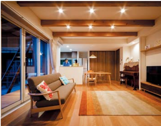
梁を見せた天井が印象を深めるLDK。リビングとウッドデッキは同じ高さで、開け放った扉が壁の中に収納できるから、開放感は格別。ダイニング扉を開けると書斎カウンターが出てくる