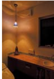
木のカウンターには陶器のボウルを配した。ブルービーズのペンダント照明がよく似合う