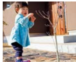
出産祝いのハナミズキとお子様。足元はアンティーク耐火レンガ