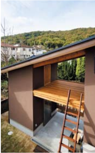
「夢の保管庫」の上には秘密基地があり、見晴らしもバツグン。夢が広がる