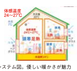
システム図。優しい暖かさが魅力

日時: 2/11(土)・12(日)・18(土)・19(日) PM1:00~PM4:00 場所: 岡山市南区浦安本町81 全館蓄熱暖房システム(B Eシステム)採用の「風のない暖房の家」。