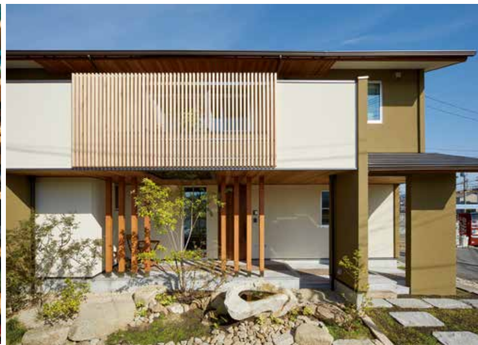
1 / 1階に8本の化粧柱、2階に米杉の格子をシンメトリーに用いて、上品なファサードを形成。模型を作って検証した。2 / 200〜300足のスケーターシューズを飾って収納