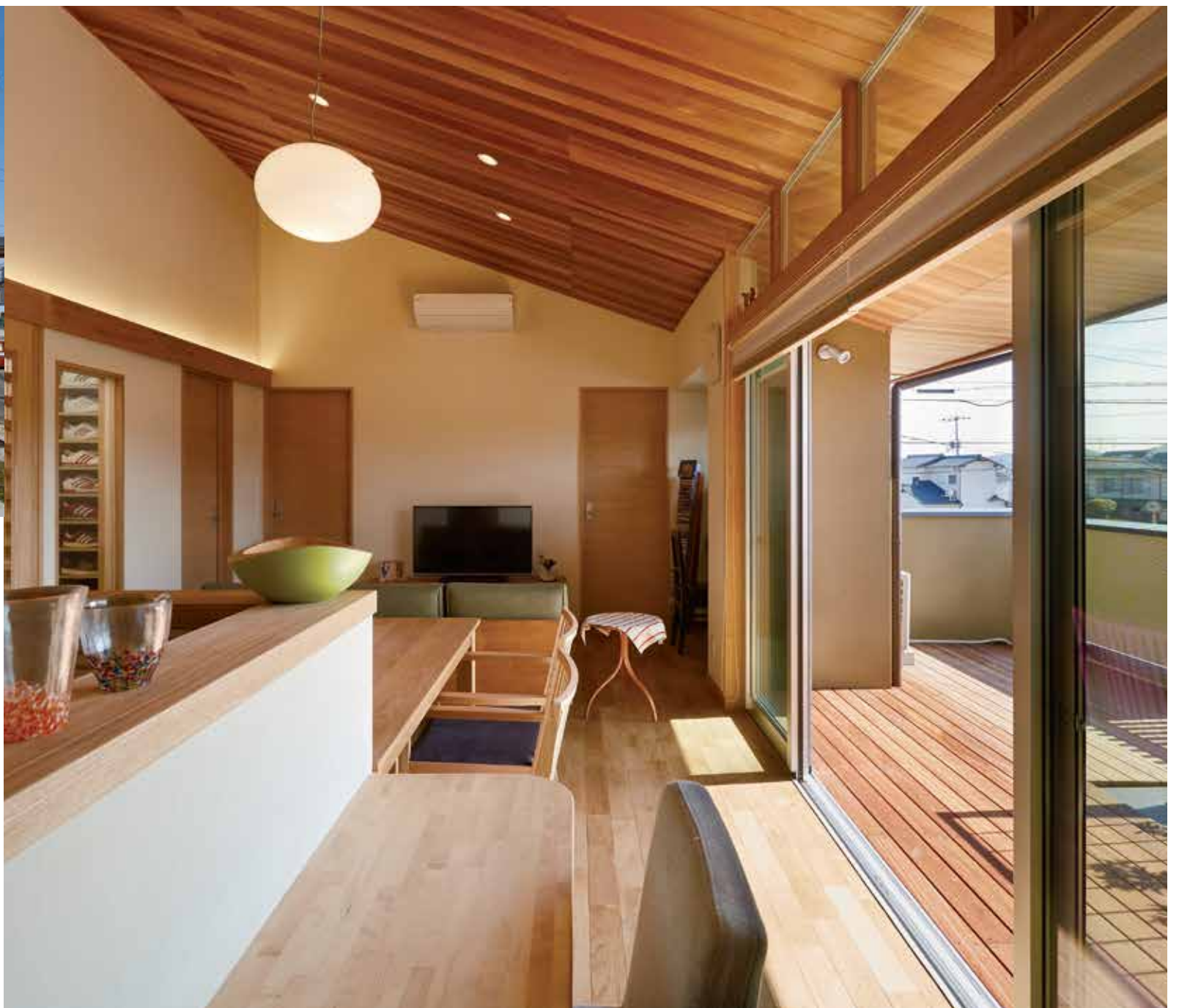
バルコニーとつながるLDKは陽光が注ぎ、風が舞う、極上の空間。リビングの天井と一体となった米杉材の軒天井が室内と屋外を連続させ、開放感を高めている (1~2P/N邸)