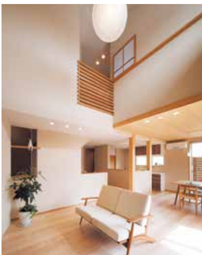
メープルの床や珪藻土の塗り壁など自然素材にあふれる

岡山工務店EXPO内モデルハウス 場所 / 岡山市南区浦安本町81 日時 / 第2&3土・日・祝日13:00~16:00は予約不要 その他の日に見学希望の方は要予約(水曜定休) 問合せ / 下記の無料電話へお気軽にお問い合わせ