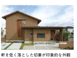
軒を低く落とした切妻が印象的な外観

「岡山工務店EXPO」で人気を博したモデルハウスを予約制で公開中。すっきりシンプルな外観、和モダンを基調としたおしゃれで使いやすい内観は必見。お見逃しなく!!