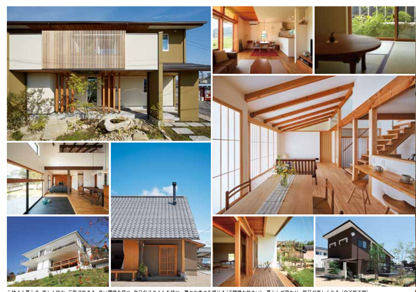
心地よく暮らす、楽しく住む、元気で生きる、良い環境を保つ、自分のスタイルを持つ…豊かな幸せを感じる〈ご機嫌な住まい〉。暮らしが変わり、毎日が楽しくなる (全て施工例)