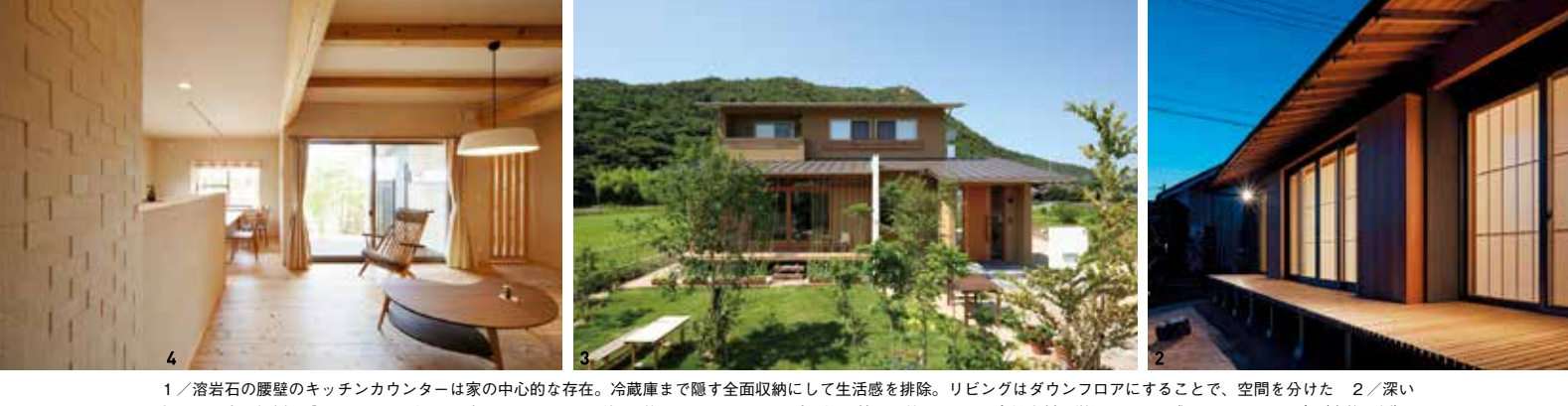
1/ 滑り石の壁のキッチンカウンターは家の中心的存在。冷蔵庫まで隠す全面収納にして生活感を排除。リビングはダウンフロアにすることで、空間を分けた。2/ 深い軒の下は広い緑を配置。明かりの漏れる障子のシルエツが趣を増す。3/ 田園風景に溶け込む端正な佇まい。4/ 自然素材を厳選し、風を感じられる平屋の家 (全施工例)