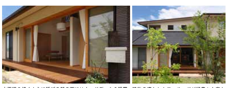
水平線を描くように延びる軒の下にはウッドデッキを設置。建物の溝としたファサードが緑豊かな庭とフルオープンな大開口の窓から眺める庭は顔絵の美しさだ。調和するN邸。自然と親しむ暮らしを満喫

電話をする FREE 0120-76-9523 正式社名 (株) 北屋建設 住所 岡山県岡山市中区平井7丁目 18-15-11 TEL 086-276-3735 URL http://www.tombo-kitaya.co.jp/