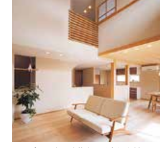
メープルの床や珪藻土など自然素材にあふれる家。見学ご希望の方はご予約を!!