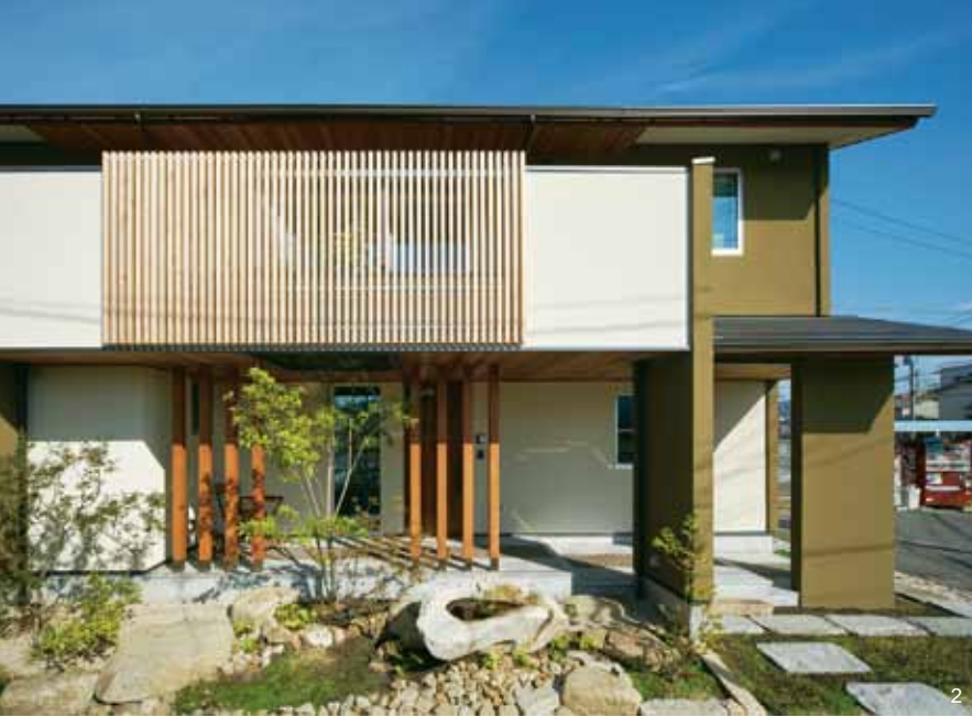
1.三世帯家族が仲良く暮らす家。2階の子世帯が過ごすLDKは、米杉板のリビング天井とバルコニーの軒が透明ガラス越しに一体となり、内と外をゆるやかにつないだ開放的な空間 2.8本の化粧柱と米杉の格子がシンメトリーを描く上品なファサード 3.リビングからバリアフリーでひと続きになったウッドデッキのバルコニー 4.キッチンの上にロフトを設置。勾配天井の印象をさらに深めている 5.子世帯に設けたシューズスペース。ご主人の趣味のスケーターシューズが鮮やかに並ぶ