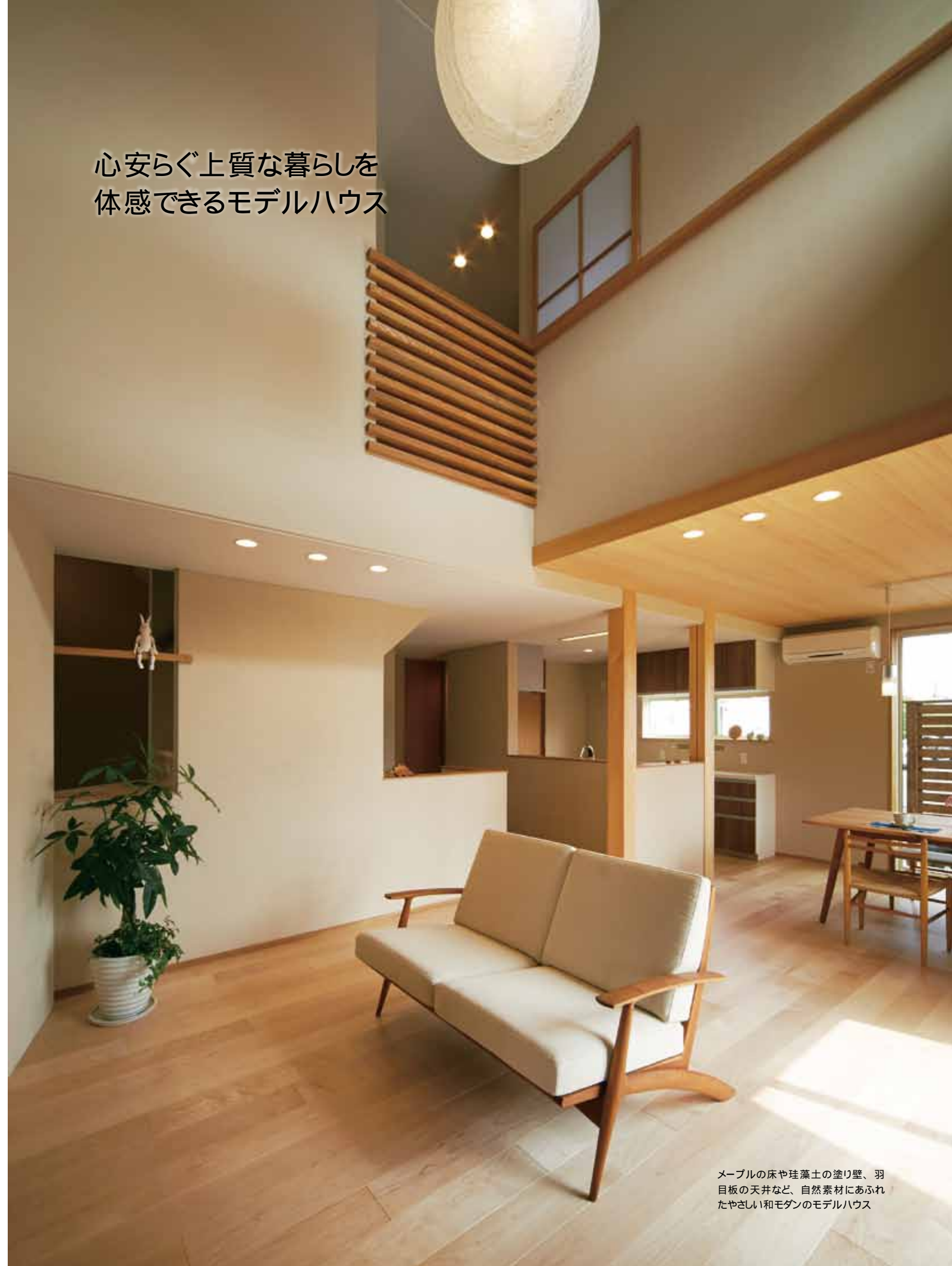
メープルの床や珪藻土の塗り壁、羽目板の天井など、自然素材にあふれたやさしい和モダンのモデルハウス