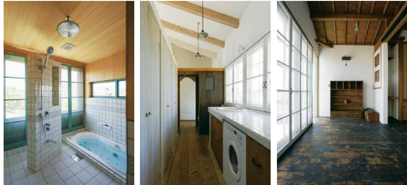
(右)2階の書斎前に広がる空間。牧歌的な景色とやわらかな自然光に包まれた特等席 (中)サニタリーの建具はかつて奥さまが営んだカフェから移設されたもの (左)メインフロアの北面に増築されたバスルーム。愛犬の洗い場も増設した