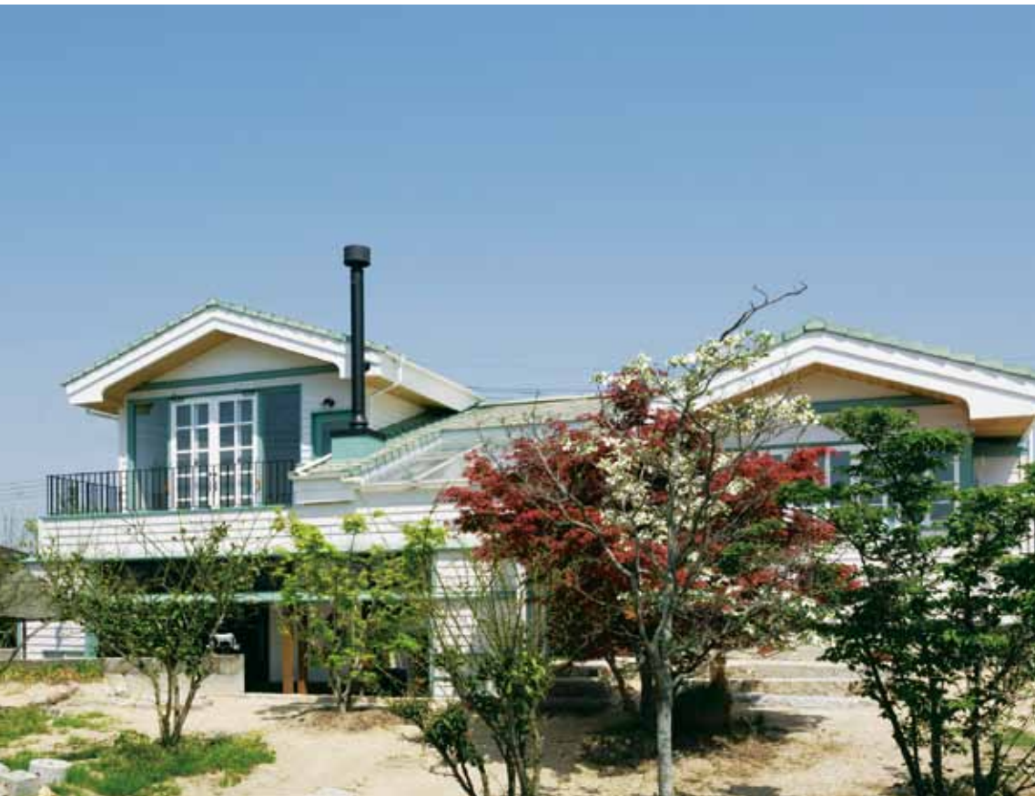
(右)高床式のエントランスは中2階。キッチン、ダイニングや書斎など活動空間は上階に、メインリビングや寝室などつろぎの空間は半地下に配されている (左)錯綜りのスギ板にミントグリーンが映えるノスタルジックな外観