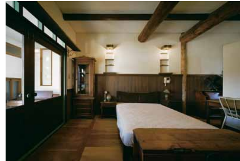
古材やアンティークなど経年して風合いを増した資材・家具をふんだんに取り入れたベッドルーム。扉上部には愛猫のためのキャットウォークも

Mさまが築18年の自邸リフォームに踏み切った理由はただ一つ。バスルームをより広くくつろげる場所にしたいからだ。 もともと奥さまが独身時代に建てたこの家が、ご主人の趣味嗜好にびたりとはまっていたわけではない。けれどそれでもMさまがこの家を超え、名作はないと深く愛し続けてきたのは、その佇まいにほかの誰にも真似できない唯一無二の世界観が広がっているからだ。技術がない、コストがかかるなど建設会社によっては住み手以上じくり手の都合が家に反映されることもある。けれどここは妻自身が間取りや素材、資材まで事細かく吟味し、「北屋建設」と何度も打ち 合わせを重ねて完成させた家。住み手の生き様をこれほど如実に表した家は、注文住宅であつてもなかなかない。 奥さまの感性の集大成ともいえるこの家での暮らしは、その後伴侶となつてからの人生にも幸福な変化をもたらした。光と影、和と洋の趣の狭間を行き交う空間に心は心地良く漂い、どこかな田舎住まいに自然に寄り添う暮らしの豊かさも知った。ご主人の特等席は、リフォームを機に得た西角2階の書斎。窓外の絶景を味わいながら、今日も満ち足りた1日が暮れていく。広くなったバスルームには愛犬専用の洗い場も設けた。この言葉姿からも幸せが紡がれる。