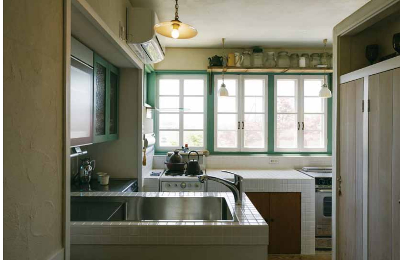
奥さまこだわりのキッチン。シンクがあった右奥のスペースには、現在業務用オーブンを設置