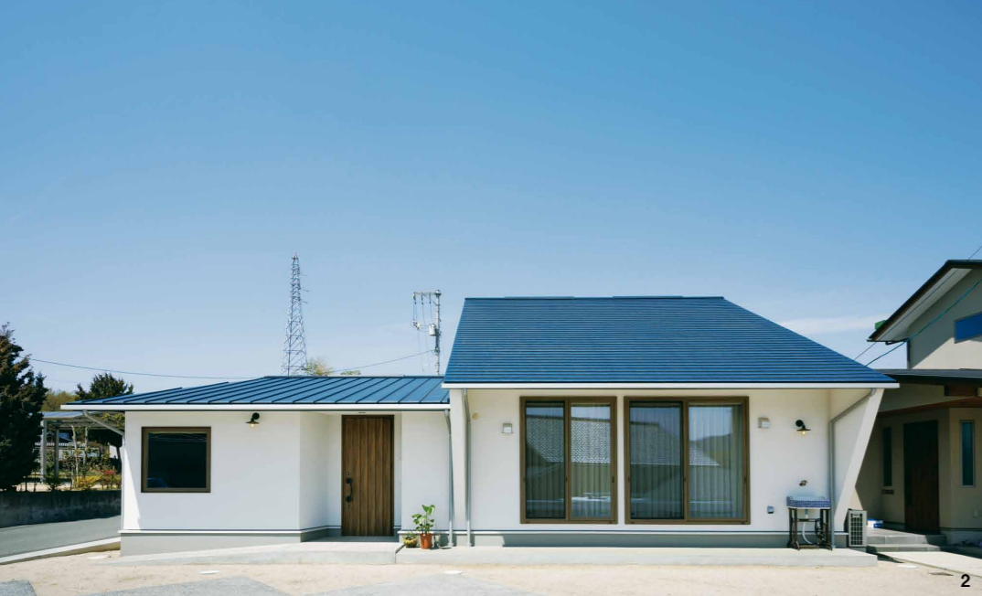
1. 軒を低くした切妻屋根の外観。木の格子をあしらった、質感ある落ち着いた佇まい 2. 高さを抑えた片流れ屋根と大きな片流れ屋根の組み合わせが印象的 3. 景色に溶け込むような瓦屋根の落ち着いた外観 4. 家の中心にある光と風を集めるインナーコートは、暮らし方の可能性を広げてくれる 5. 錯張りの杉板にミントグリーンが映えるノスタルジックな雰囲気