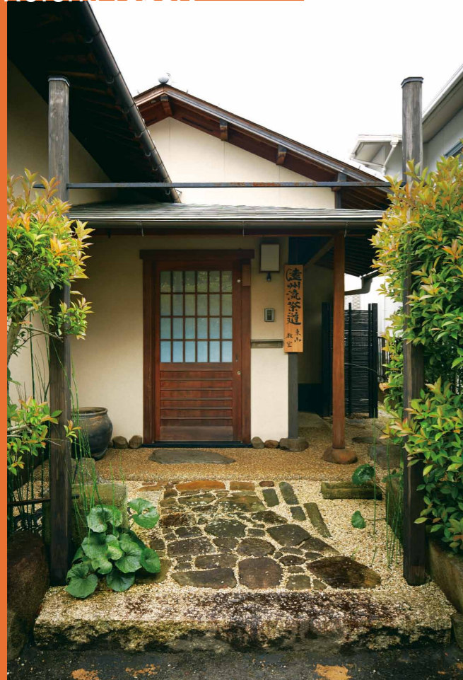
門がなかったため、柱2本に鉄棒を入れて鳥居にみたと、静謐な佇まいが実現した