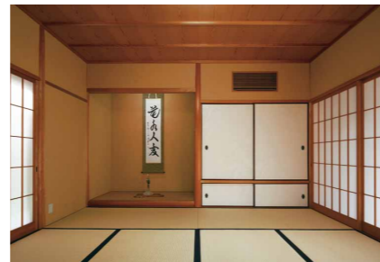
壁を塗り、襦はひょうたん柄の雲肌大札紙に張り替えた