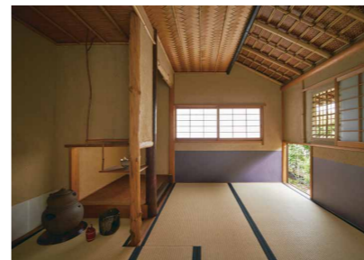
襦り口をくぐれば、静寂さに満ちた凛とした空気が広がる