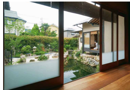
ご夫婦で少しずつ手を入れた庭は、四季折々の顔を見せる

アピールポイント 提案力 心地よく暮らす、楽しく住む...豊かな幸せを感じる住まいを提案 耐震・耐久性 職人技と耐震・断熱等の性能、進化するデザインで家を作る 健康 / 癒し 長期優良住宅・ゼロエネルギー住宅、全館蓄熱暖房BEシステム