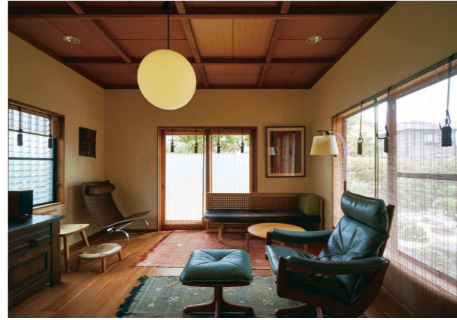
床をブラックチェリーに張り替え、インテリアをコーディネートして上質で落ち着いた空間に