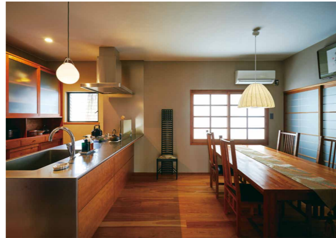
ナチュラルモダンなオーダーキッチン、ブラックチェリーの床材ともうまく調和している