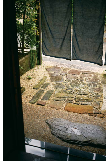
リフォーム前の造りをほぼ活かした玄関口