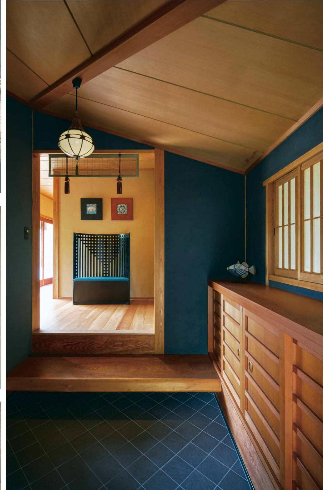
ご主人の要望で、壁は黒の塗りに。モダンな空気を取り入れながらも、塗りならではの味のある落ち着いた雰囲気

会社概要 株式会社 一級建築士事務所 飛夢房 +株式会社 北屋建設 お問い合わせ先 TEL.050-5871-9398 代表番号 / 086-276-3735 URL / http://www.tombo-kitaya.co.jp e-mail / info@tombo-kitaya.co.jp 岡山市中区平井7-18-15-11 9:00 ~ 18:00 (水曜日、第1日曜日定休、木曜日不定休) (予約対応可)